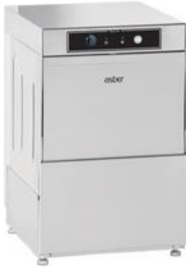
Lavado de vajilla - Grand Series - Easy Line - Lavavasos 400